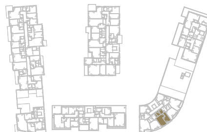
Schéma podlaží _____