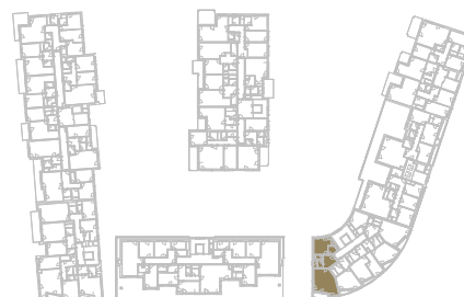
Schéma podlaží _____