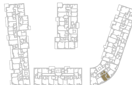
Schéma podlaží _____