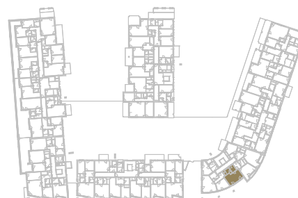
Schéma podlaží _____