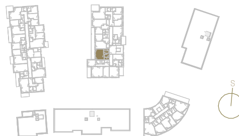
Schéma podlaží _____