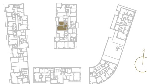
Schéma podlaží _____