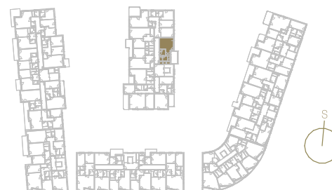
Schéma podlaží _____