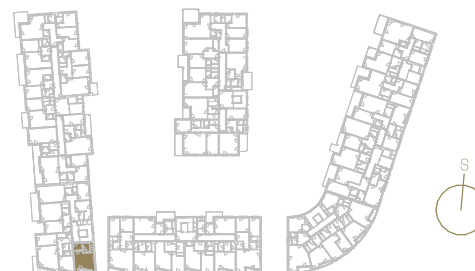
Schéma podlaží _____