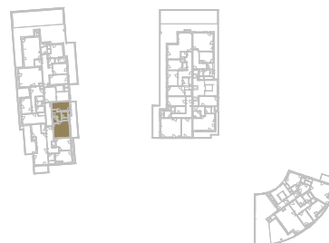
Schéma podlaží _____