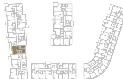
Schéma podlaží _____